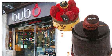
1.2016年春には、日本初上陸を果たす高級パティスリー 2.サン・オル・SAINT HONORÉ €4.20.たっぷりのフランボワーズとチョコレートが好相性 3.店の代表作シャピナXABINA€4.20.2005年チョコレートケーキ世界大会で最優秀賞を受賞したケーキ

data ④4号線JAUIME I 駅から徒歩7分 ⑤C. de les Caputxines 10 ☎93-2687224 ⑥10～22時(金・土曜は～24時) ☎なし