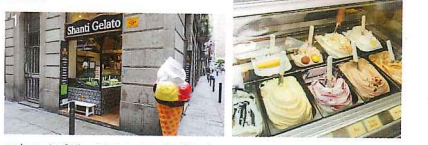
1.右のオブジェのアイスはゴミ箱になっている 2.常時16種のフレーバーが日替わりである。人気は濃厚なチョコレートフレーバー

data ④4号線JAUIME I 駅から徒歩7分 ⑤C. dels Carvis Vells 2 ☎93-2680729 ⑥13時～23時45分(金・土曜は～翌1時30分) ※冬期は不定 ☎なし link →P21