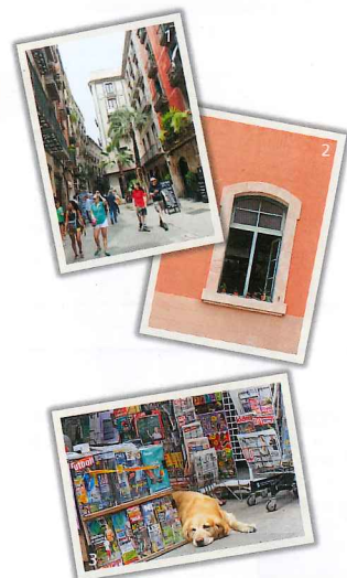
1.2.センスのいいショップやバルが並ぶなか、人の暮らしも垣間見れる 3.暑い夏は看板犬も休憩中

歴史ある街並みにモダンなショップが溶け込み、オシャレなエリアとして話題のボルン地区。グルメ専門店も多いので、のんびり散策しながら、おみやげを探したり食べ歩きを楽しもう。