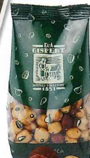
1.創業当時の趣が残る店 2.店内の古い炉でナッツを炒る 3.ヘーゼルナッツ€1.90/100g 4.リエタ島のアーモンド€11/500g

data ④4号線JAUIME I 駅から徒歩5分 ⑤C. dels Sombreterers 23 ☎93-3197535 ⑥10～14時、16～20時(11月17日～12月24日は10～20時) ☎日曜