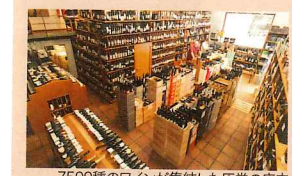
7500種のワインが集結した圧巻の店内

data ④4号線JAUIME I 駅から徒歩8分 ⑤C. Agullers 7 ☎93-2683159 ⑥8時30分～20時30分(7・8月の土曜は～14時30分) ☎日曜 link →P29