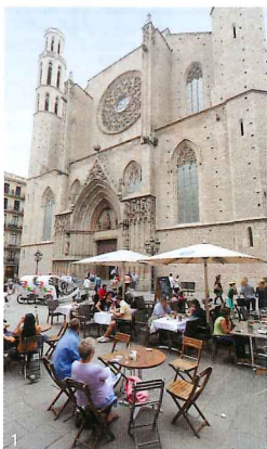
1.テラス席の目の前はサンタ・マリア・ダル・マル教会 2.上質なオイルとトマトの酸味が食欲をそそるパン・コントマテ€3 3.角切りスモークサーモン€7.10 4.スペイン産チーズ3種盛合せ€7.95

data ④4号線JAUIME I 駅から徒歩7分 ⑤Pl. Santa Maria 5 ☎93-3103379 ⑥12時30分～翌1時30分(金曜は～翌2時、土曜は12時～翌2時、日曜は12～24時) ☎なし